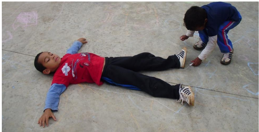
IMAGEM DE COMO FAZER A ATIVIDADE:

A atividade será trabalhar o corpo humano, onde a criança deitará no chão e o adulto com um giz fará o contorno do corpo. Em seguida, mostrar a criança o desenho do seu corpo e questionar o que falta. Faça com que a criança perceba e complete com desenhos: os olhos, boca, orelhas, nariz, cabelo, roupas, entre outros detalhes.